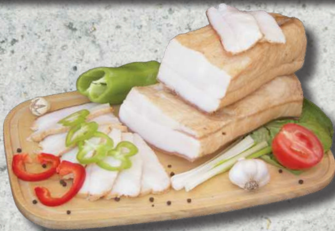
PALINI CSEMEGE FÜSTÖLT SZALONNA