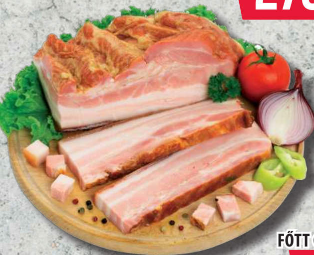
NAGYKUN FÜSTÖLT FŐTT CSÁZÁRSZALONNA