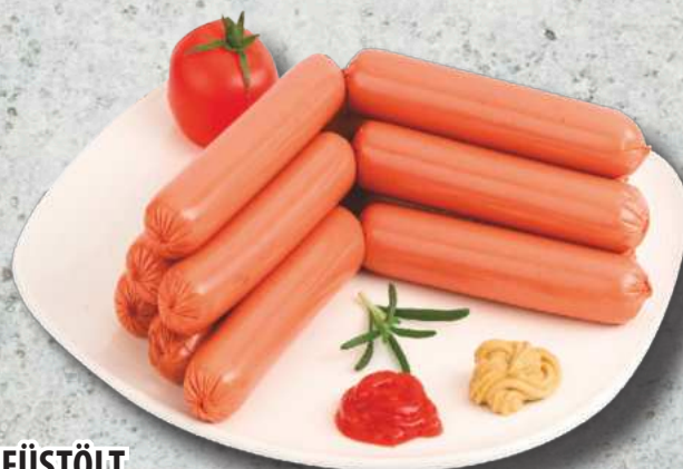
NAGYKUN SERTÉS VIRSLI