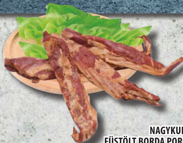
NAGYKUN FÜSTÖLT BORDA PORC PÁCOLT, ELŐHÚTOTT